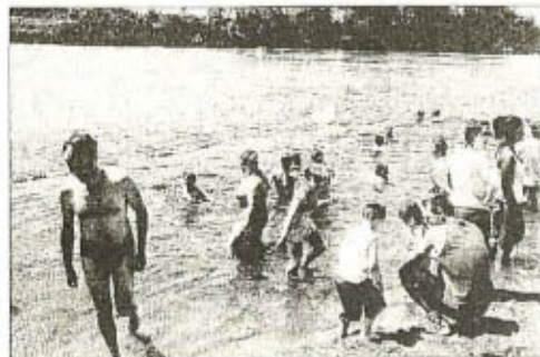
Surveillée, la baignade a été exceptionnellement autorisée.

Avec un petit budget, inférieur à 5.000 €, la ville a su créer l'événement et rassembler. « Cette journée s'est déroulée dans l'état d'esprit qu'on voulait : convivialité, simplicité, bonne humeur.