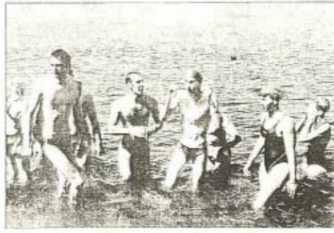
Aidés par le courant, les membres du club de natation sont arrivés à la Belle-Laveuse après moins d'une heure de descente de la Vienne.