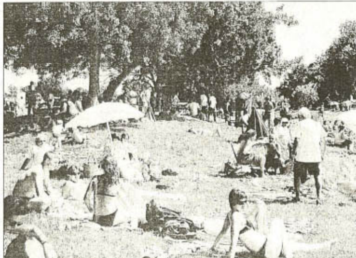
Farniente et bronzette. Ambiance très plage à la Belle-Laveuse.

nageurs de la piscine ont surveillé les baigneurs durant tout l'après-midi et particulièrement à 15 h, pour le Big Jump alors que près de 150 personnes se sont jetées à l'eau en même temps. Le matin, les nageurs confirmés avaient testé l'eau et descendu la Vienne depuis Rivière jusqu'à la Belle-Laveuse. « C'est un vrai bonheur ! L'entrée dans l'eau est un peu froide mais c'est très agréable », décrit Marie-Noëlle Hennebel, conseillère municipale qui a nagé les 2,5 km entre Rivière et Chinon. « Se baigner en