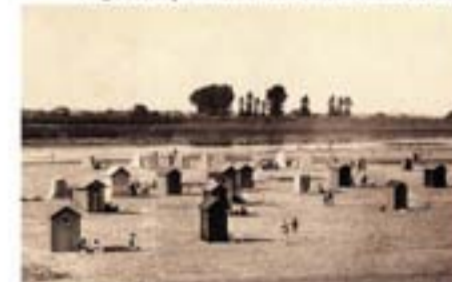
Plage des Ponts-de-Cé - Éd. L.Jaurès Angers