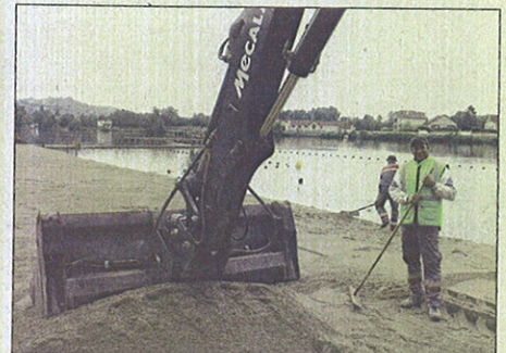
La dernière touche aux aménagements de la plage était donnée cette semaine. Tout sera prêt pour quand le soleil voudra bien pointer son nez.