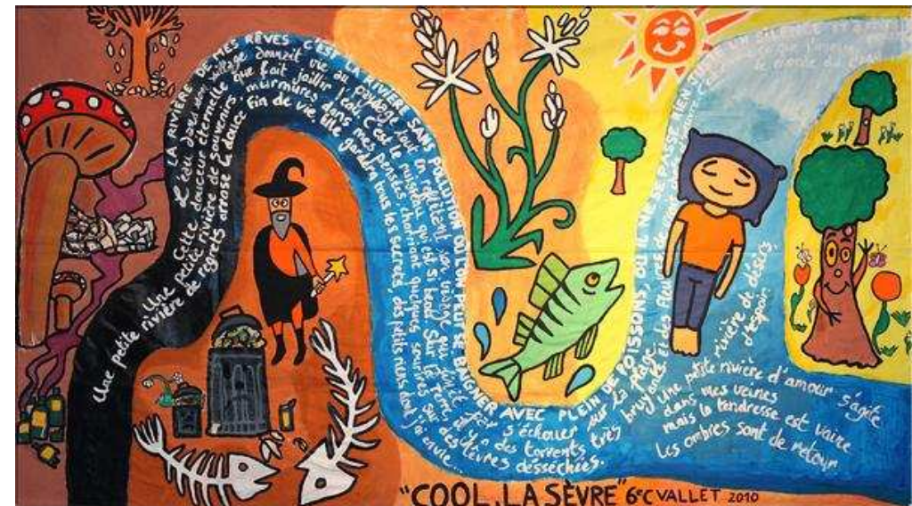
TOILE DE 1M50 X 2M50, COLLEGE SAINT JOSEPH, 6EME C, 44330 VALLET, EDITION 2009 - 2010