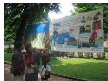
Exposition RIFM au jardin Henry Vinay (43) en 2006

les œuvres du concours RIFM. Le jury de cette 17ème édition se réunira quant à lui le vendredi 13 juin pour désigner les œuvres lauréates. Plus d'informations sur les 25 ans de SOS Loire Vivantes : RDV sur www.sosloirevivante.org