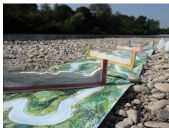
Malle pédagogique sur la dynamique fluviale

Documents à télécharger pour enrichir vos découvertes et donner