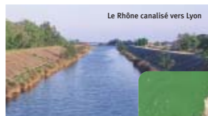
Le Rhône canalisé vers Lyon

L'eau dégradée : eutrophisation dans une retenue de barrage