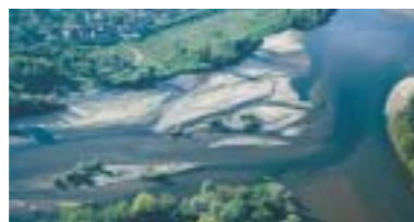
La Loire au Bec d'Allier (confluence)