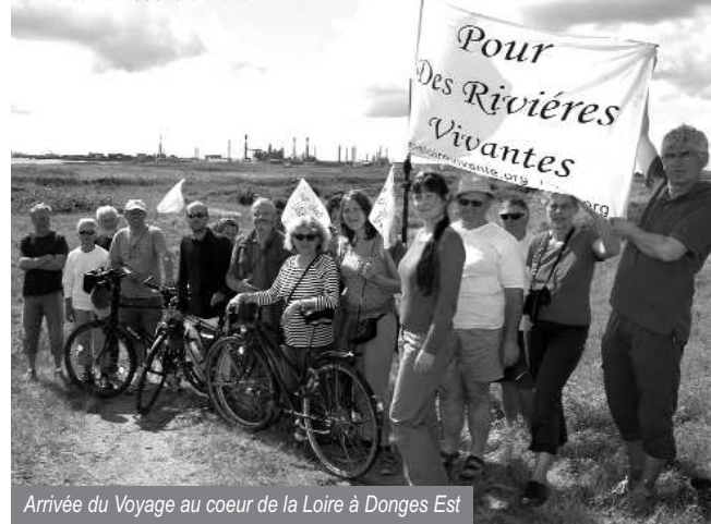
Arrivée du Voyage au cœur de la Loire à Donges Est