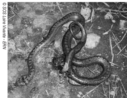
Coronelle lisse littéralement déchiquetée sur le parcours après l'endurance d'Arlempdes

Si des concours sont organisés dans les Gorges de la Loire, pourquoi eux-mêmes ne pourraient-ils pas s'y entraîner ? C'est d'ailleurs précisément ce qu'ils font puisque la vallée n'a pas cessé de rugir encore cet été, avec des dizaines de motos qui y ont circulé, enfreignant la Loi de 1991 relative à la circulation des engins motorisés dans les sites naturels.