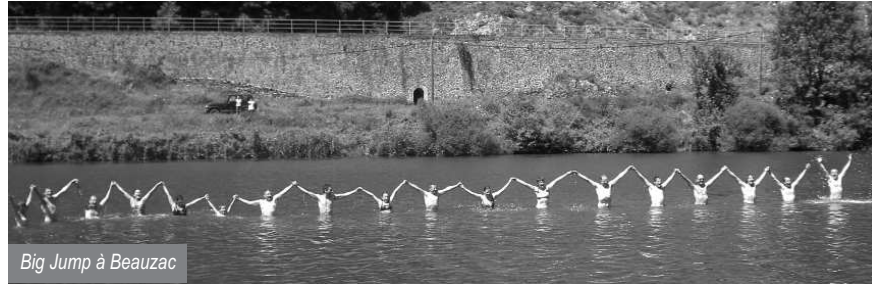
Big Jump à Beauzac

Un peu partout sur la Loire, l'Allier, la Vienne et d'autres affluents, en une quarantaine de lieux, des milliers de baigneurs sont venus se rafraîchir dans les rivières, dimanche 15 juillet. La chaleur de cette journée était bienvenue avec une mobilisation importante pour ce Big Jump Ligérien. Des centaines de personnes en Haute Loire, plus d'un millier à Vichy et autant à Chinon... le premier « grand saut dans la Loire » a eu lieu, bien relayé par les médias.