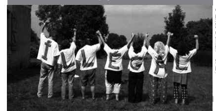
Manifestation contre le jugement