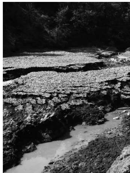
Plusieurs mètres de boues et de sédiments évacués lors du démantèlement

Nous organiserons une nouvelle balade pour voir l'état de la Beaume au printemps prochain. Mais nous faisons confiance à la rivière Beaume pour reprendre ses droits et retrouver sa totale liberté d'ici quelques temps !