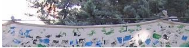
Toile suspendue au câble