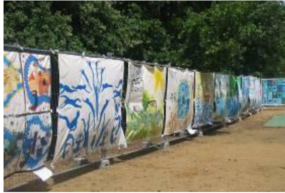
Accrochage des doubles lacets