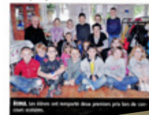
La classe de Prédicte Par... Les élèves ont reçu deux prix pour leur implication dans le projet.