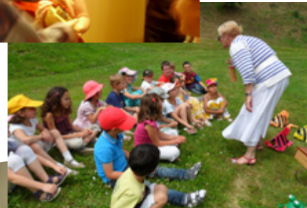
Passage des conteurs dans les écoles lauréates