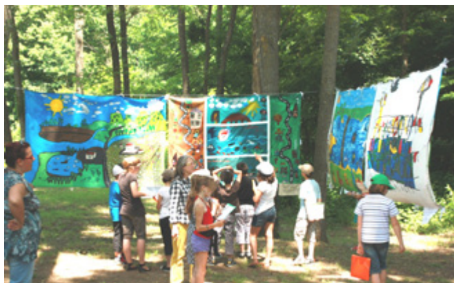
Le jury enfant et adulte étudient les oeuvres des participants