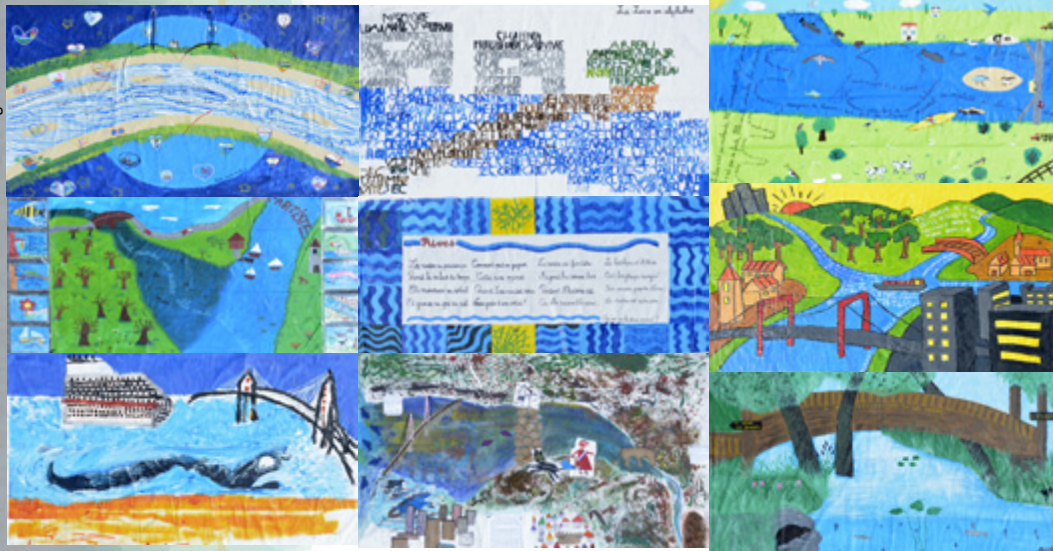
Les oeuvres lauréates du concours RIFM 2013