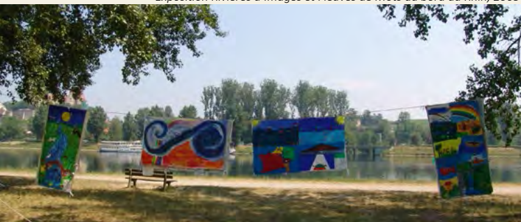
Exposition Rivières d'Images et Fleuves de Mots au bord du Rhin, 2005

Toutes les toiles sont conservées par SOS Loire Vivante - ERN France et mises à disposition gratuitement.