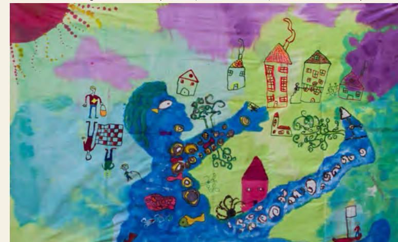
« Quelle énergie mon Mardeloup chéri ! », 1 er Prix RIFM 2014, 42 370 Saint André d'Apchon

L'exposition des oeuvres est une manière de reconstituer la carte artistique du bassin versant . Au fil du fleuve et de ses affluents elles permettent de découvrir ou redécouvrir les richesses d'un héritage naturel.