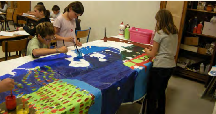
Les élèves de l'école Larbaud Curie travaillant sur leur oeuvre, « La Rivière des fantaisies migratoires », Prix Coup de Cœur RIFM 2011, 03 270 Saint Yorre

ANCE Autrefois, j'étais goutte de pluie, Flocon de neige ou ruisselet. Maintenant, je suis l'Ance dorée Découvrant des espaces infinis.