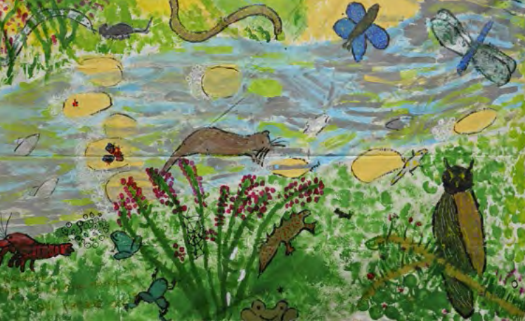
« La Gazeille, refuge ou garde-manger, qui croque qui ? », Prix Spécial Loire Vivante RIFM 2012 43 150 Le Monastier-sur-Gazeille