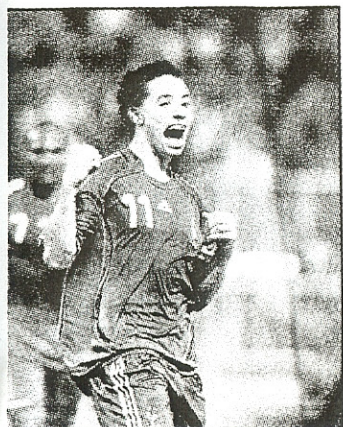
ardent la tête de leur groupe