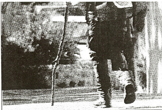
ARCHIVES CÉLIK ERKUL