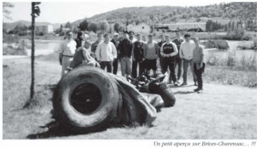
Un petit aperçu sur Brives-Charensac... !!!

Une visite de la déchetterie de Polignac a conclu une journée d'action riche d'enseignements pour ces jeunes, et pour nous !