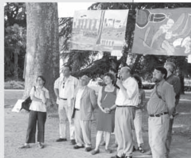
Jury en pleine délibération.