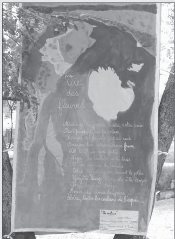
Prix European Rivers Network / SOS Loire Vivante - "Vie des Fleuves" CE2/CM1 de l'école des Grands Champs 37550 St-Avertin.

"RhineNet" voir article dans ce même bulletin. Dans ce cadre et en collaboration avec les partenaires du projet d'Allemagne, des Pays bas, du Luxembourg et de France, "Rivières d'Images et Fleuves de Mots" "s'européanise" et sera mis en place sur tout le bassin versant du Rhin dès la rentrée 2004-2005.