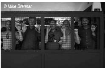
L'équipe de tournage emprisonnée en Argentine

Le Barrage de Yacyretá est l'une des centrales hydroélectriques les plus grandes au monde.