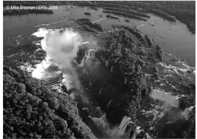
Chutes de Iguazu Argentine / Brésil

Aujourd'hui, il manque 7 mètres d'eau pour que le barrage soit entièrement rempli. Chaque semaine la hauteur d'eau monte de quelques centimètres poussant plus de 60 000 personnes à quitter leurs habitations. S'ils ne sont forcés par l'eau ils le sont par des unités paramilitaires du côté de l'Argentine comme du côté du Paraguay.