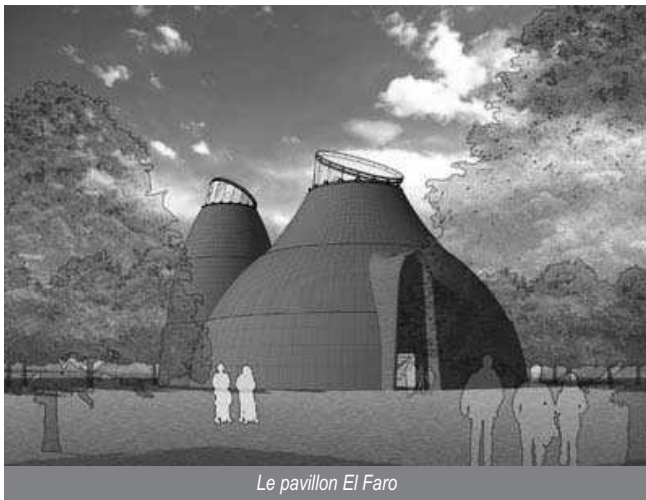
Le pavillon El Faro

SOS Loire Vivante - ERN France participe à l'exposition universelle de Saragosse, en Espagne, qui a pour thème l'eau, du 14 juin au 14 septembre 2008.