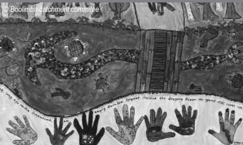
Toile réalisée par des enfants aborigènes

Le projet est basé sur le même principe que celui de la Loire et les oeuvres ainsi réalisées circuleront sur trois bassins versants différents en Australie. Elles seront également valorisées par l'édition d'un calendrier reprenant les toiles australiennes et une version internationale est envisagée.