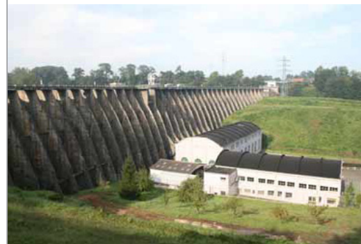
Le barrage de Vézins, haut de 36 m

Ce film, coproduit par EDF, l'Onema, le Ministère de l'Ecologie, l'Agence Seine Normandie, présente l'arasement des barrages de Poutès et Vézins. Disponible sur : http://www.dailymotion.com/Agenceeauseinenormandie