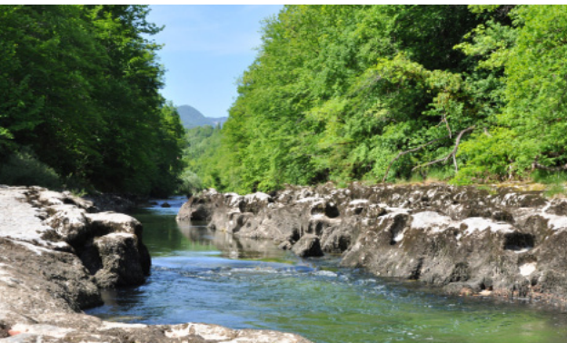
La Valsérine

(article complet dans la revue «Sauvons l'eau» http://www.sauvonsleau.fr/ )