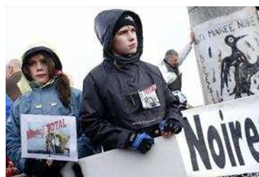
250 personnes ont manifesté samedi à Saint-Nazaire leur colère devant cette nouvelle marée noire tant que les différents chantiers de dépollution se poursuivaient tout le week-end pascal.

Une semaine après l'incident survenu lors du chargement d'un navire à la raffinerie Donges, les dernières observations sur la faune de l'estuaire sont inquiétantes. L'oiseaux pourraient, à terme, payer un lourd tribut.